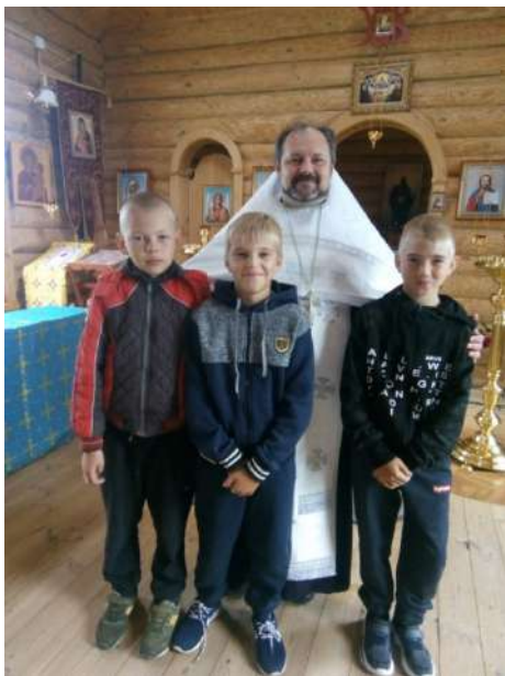
В Никольском храме отслужен молебен перед началом учебного года

И в рубрике «Жизнь прихода» мы поделимся с вами особо значимыми событиями Никольского прихода села Дигилевки, несущими Благую Весть.